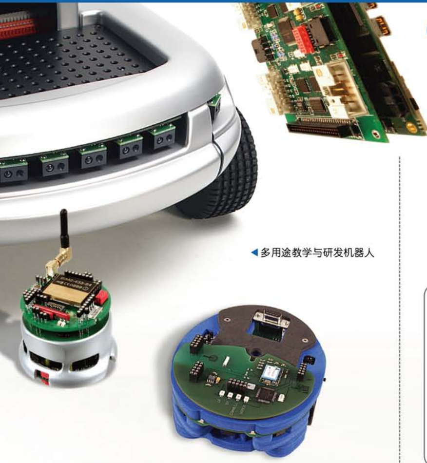
◀ 多用途教学与研发机器人