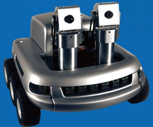
▲ Koala-世界最小的全地形适用机器人

K-team 机器人产品经过特殊的设计，耐用、稳定且非常容易上手，即使不是很有经验的客户，也可以顺利地进入状况。在实际使用的同时，客户也可以明显地感受到K-team产品的便利性，也就是能真正地做到所谓的“随插即用”。K-team的机器人兼具了高效能与精简的尺寸，客户可在有限的空间里把K-team的产品设定好到开始作业，K-Team的Koala是目前世界最小的全地形适用(Full Terrain)的机器人之一。